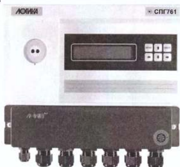
Рисунок 1 - Корректор СПГ761 (СПГ762)