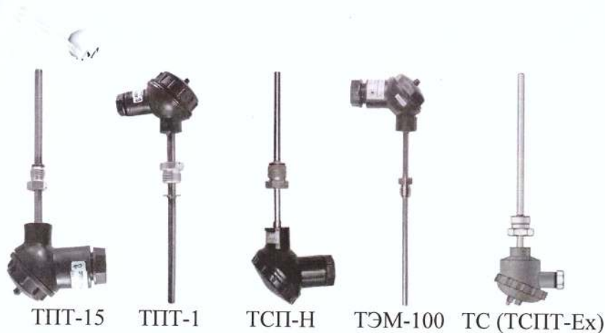
Рисунок 5 - Преобразователи температуры