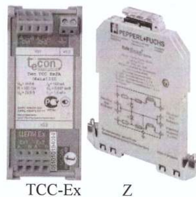
Рисунок 6 - Барьеры искрозащиты